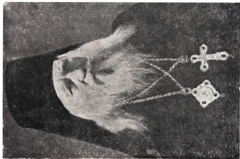
Преподобный Алексей, епископ Пяршевский